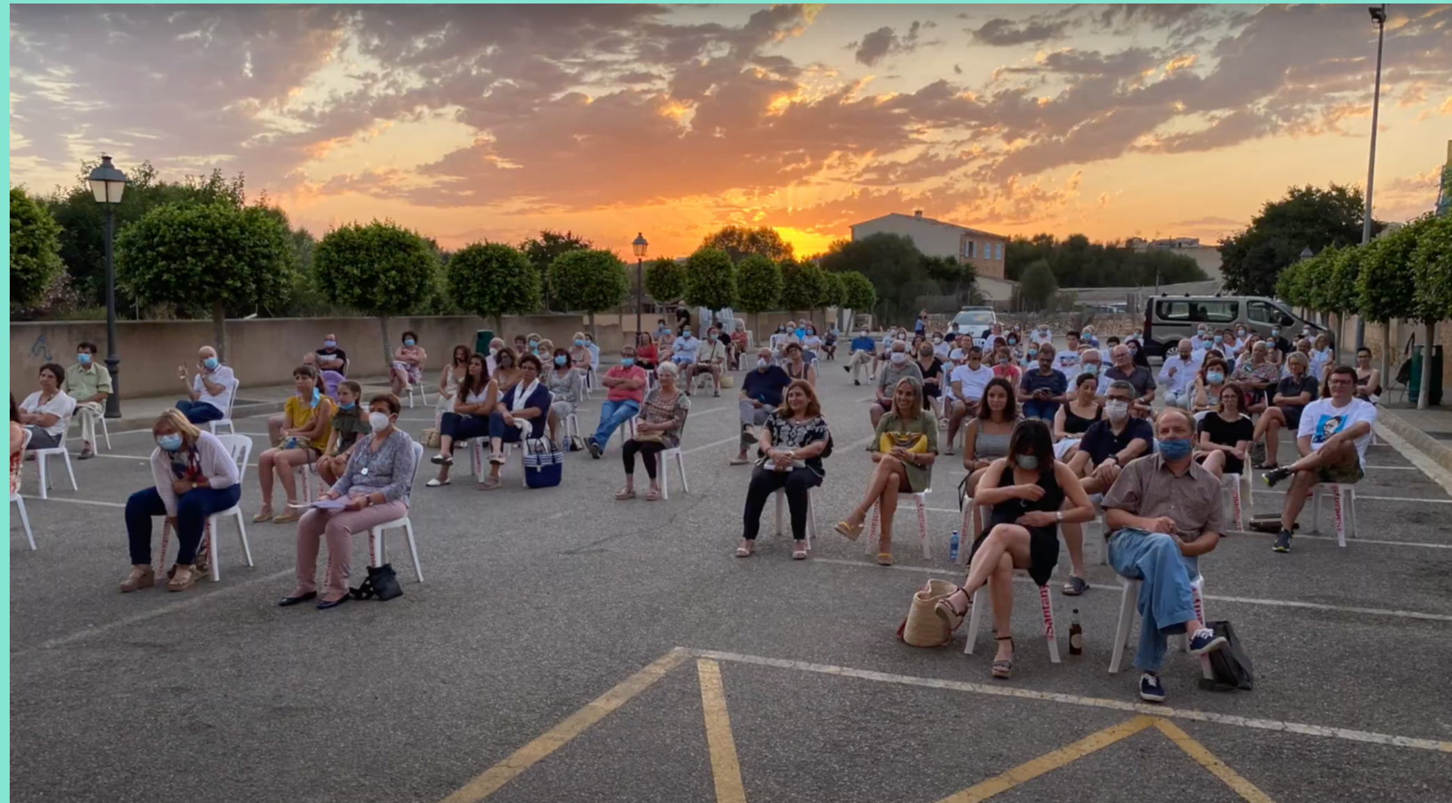
Exterior del Teatro Principal de Santanyí