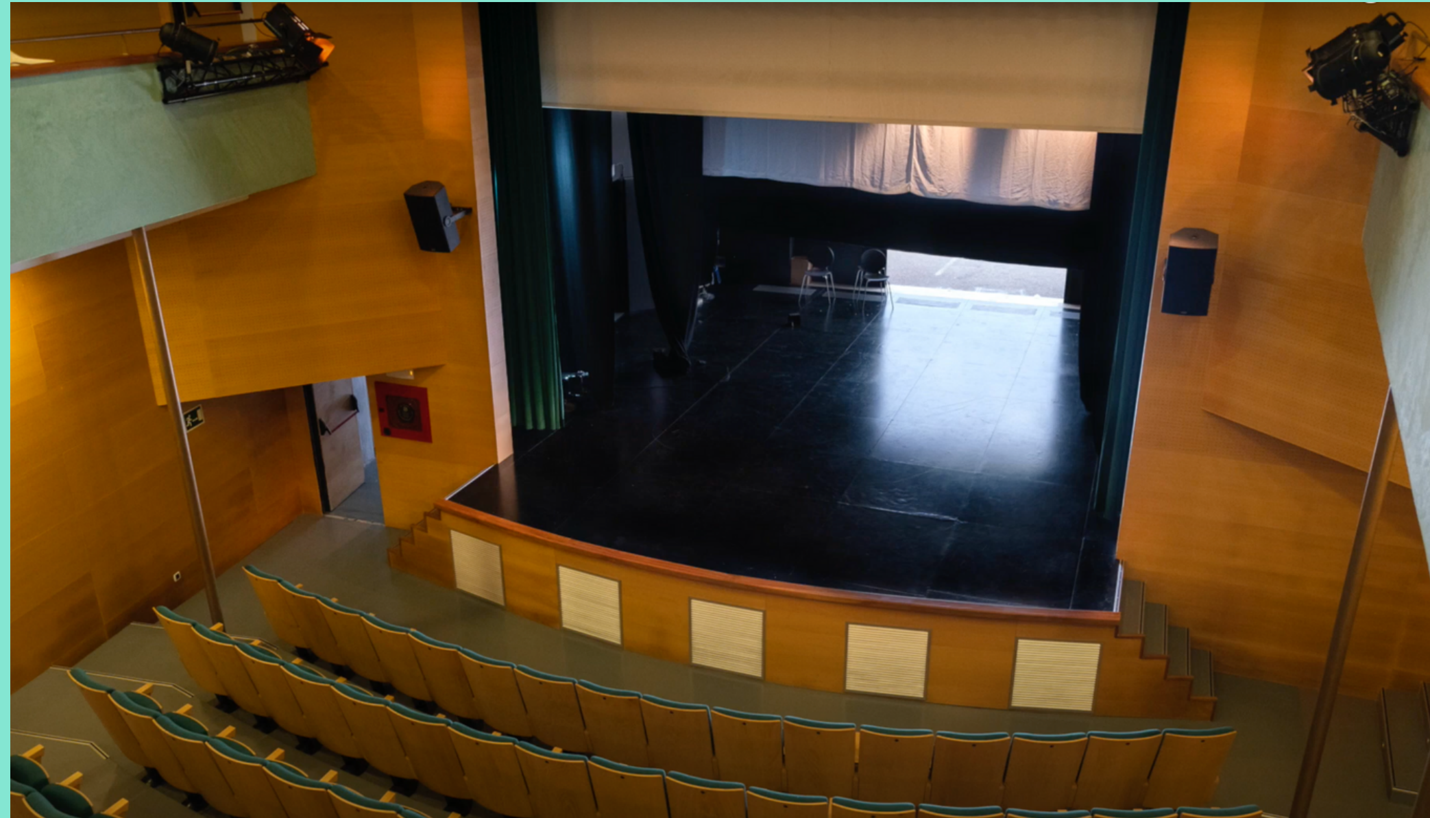
Interior del Teatro Principal de Santanyí