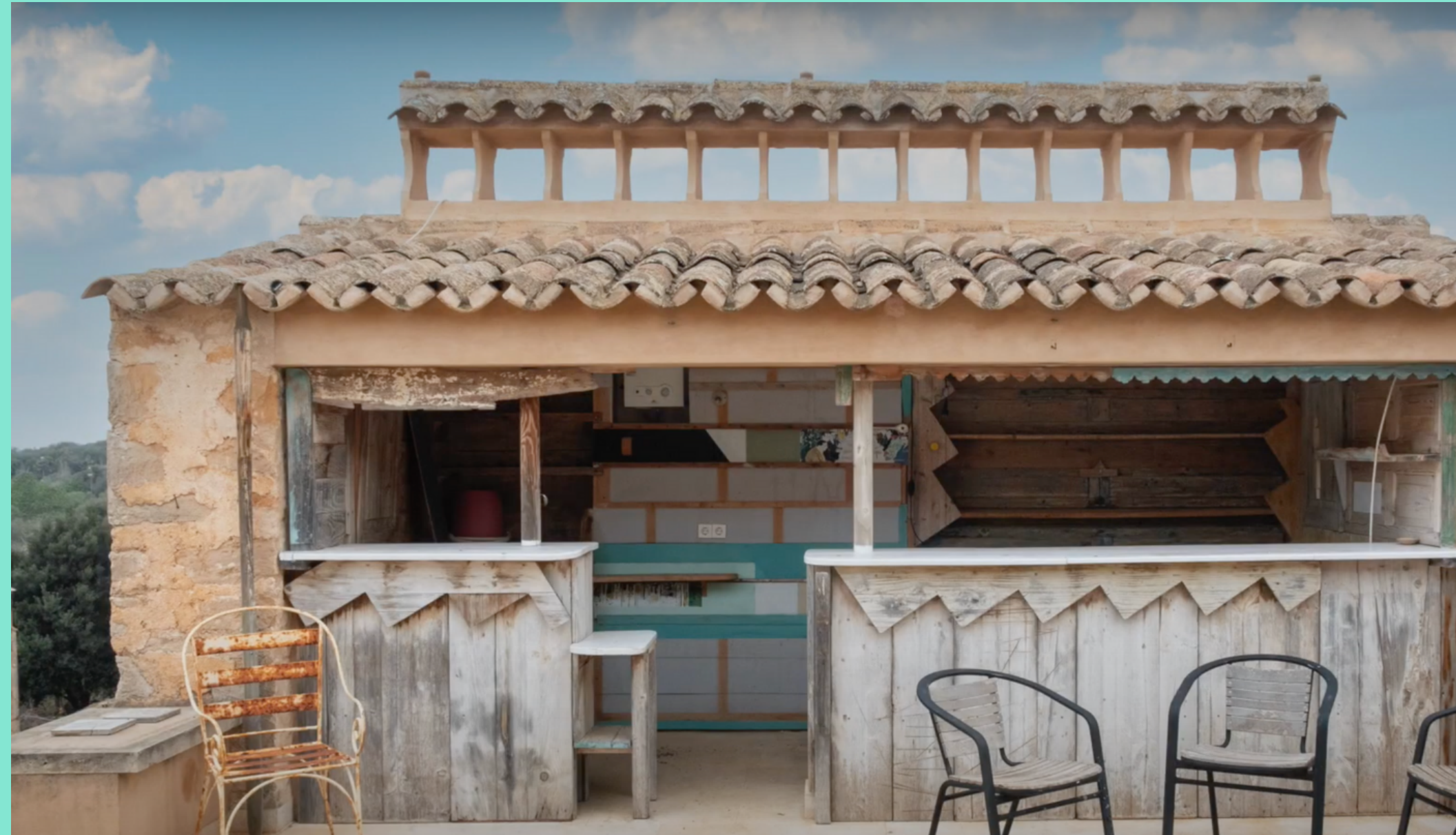
Terraza de Can Timoner