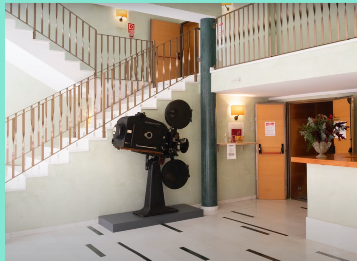
Vestíbulo del Teatro Principal de Santanyí

Gracias a la gestión de servicios del teatro por parte de la productora Tshock, los residentes pueden disponer de un espacio técnico para ensayos y pre- estrenos o estrenos. El teatro dispone de 180 asientos y un escenario de 12 x 10 m2, así como equipo de sonido y luz profesional.