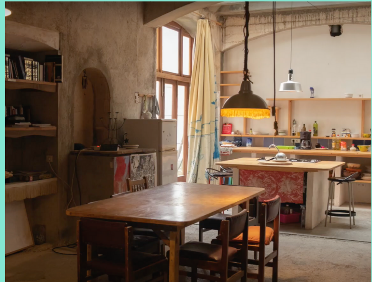
Cocina de Can Timoner

Es el espacio de alojamiento de los residentes. Se trata de un casal de 600 metros en medio del centro de Santanyí. Bajo petición previa se pueden alojar hasta 8 personas. El espacio cuenta con 5 habitaciones, cocina, dos baños, tres terrazas, diferentes espacios de ocio y tres salas.