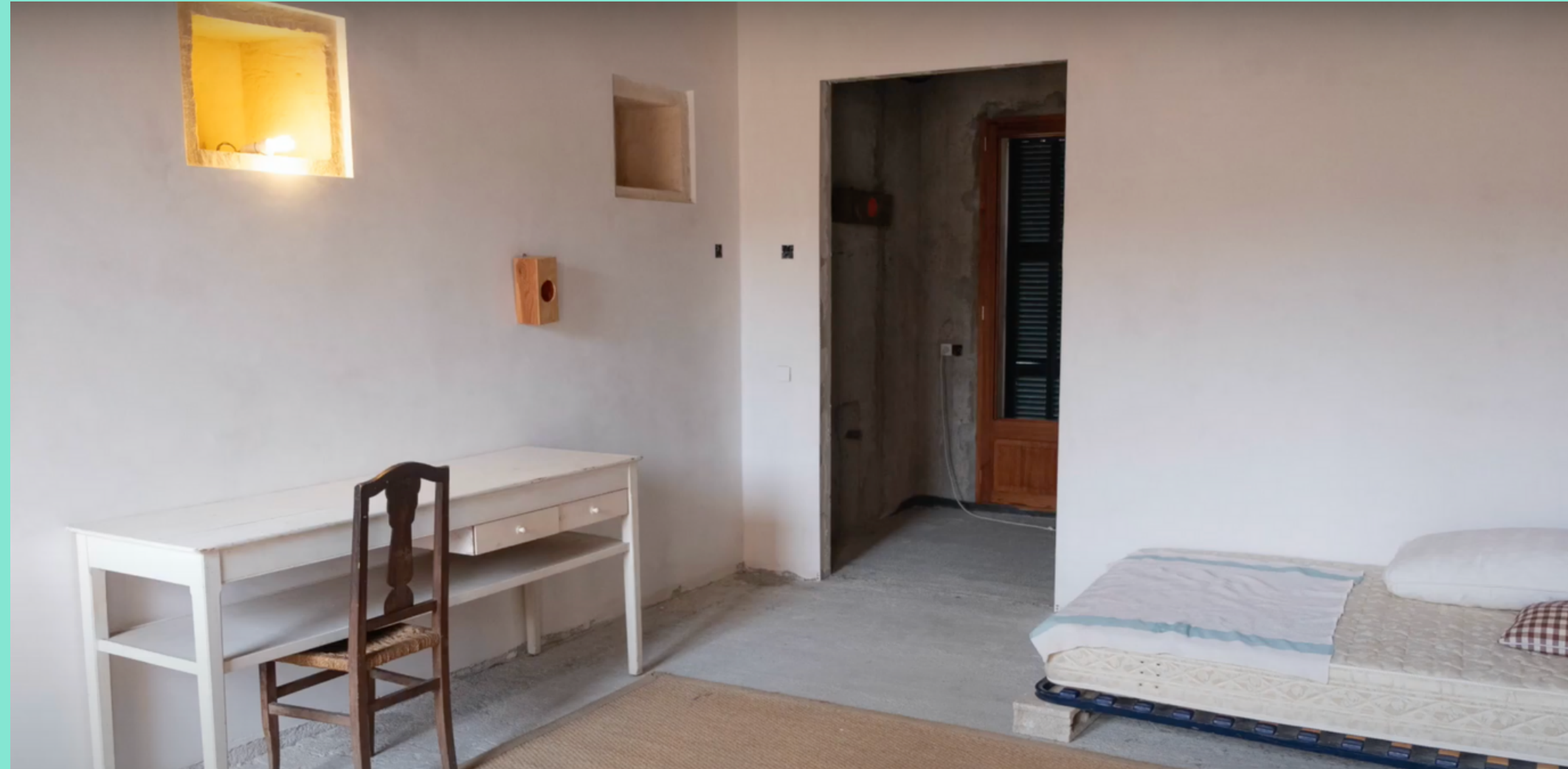
Una de las 5 habitaciones de Can Timoner