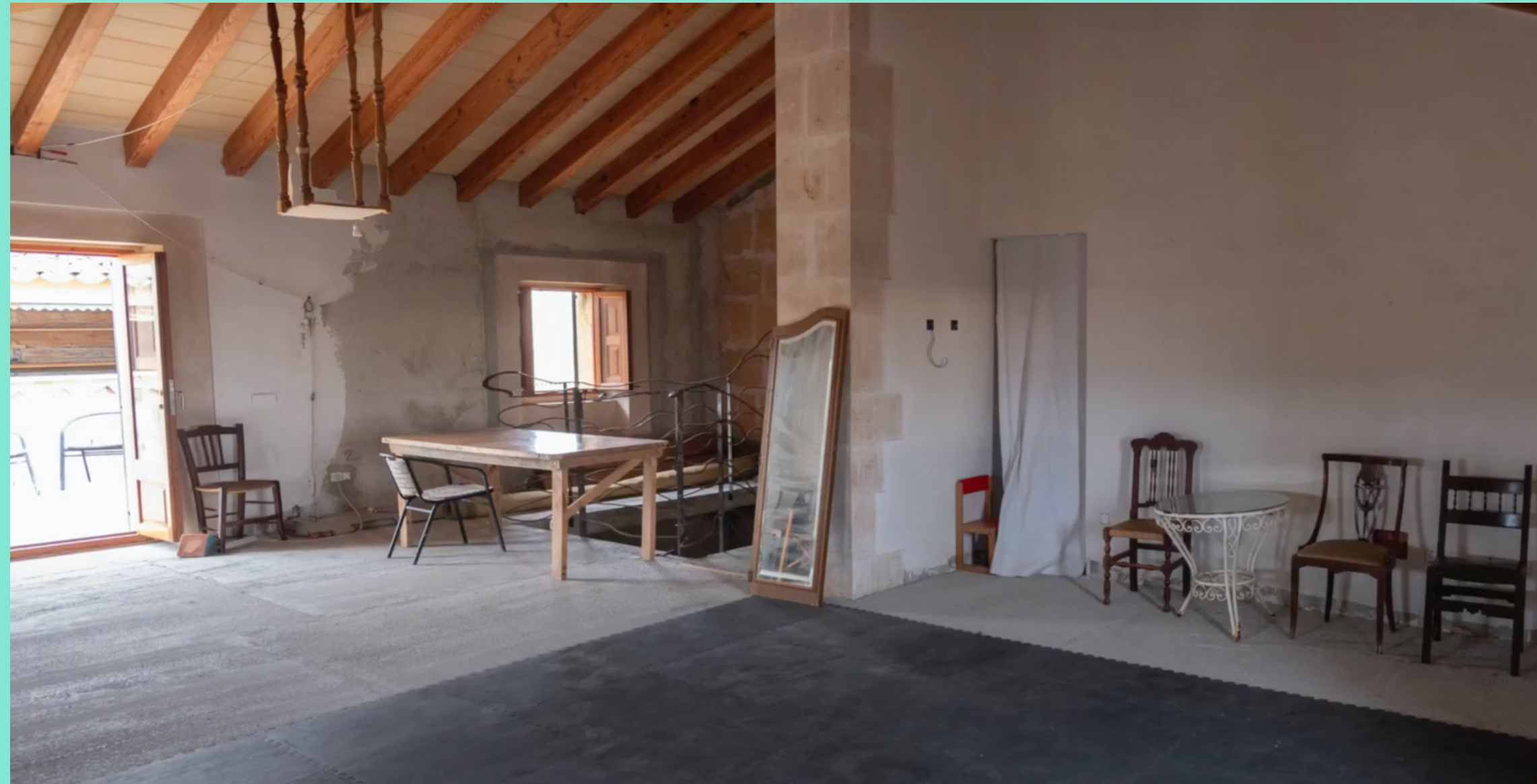
Sala de la tercera planta de Can Timoner